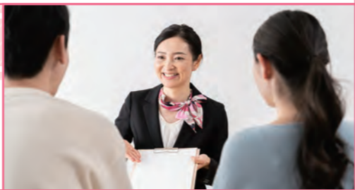
写真やイラストはイメージです。

ご自宅の最適な電気料金プランのご提案や、会員制Webサービス「よんでんコンシェルジュ」登録のお手伝いなど、電気に関するご相談にお応えします。